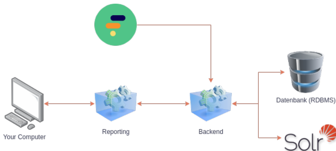
Abbildung 1.1. Analytics Komponenten

Die folgende Grafik veranschaulicht das Gesamtsystem von Formcentric Analytics und bietet einen ersten Einblick in die Architektur.